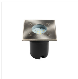
GORDO N 1W CW-L-SR