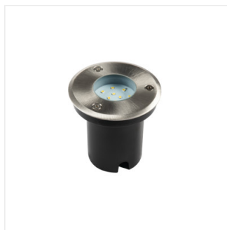
GORDO N 1W CW-O-SR