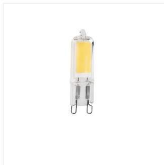
G9 GLASS LED2W